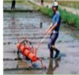
বোকা মাটিত ড্ৰাম ছিঁদাৰ দ্বাৰা ধান সিঁচা