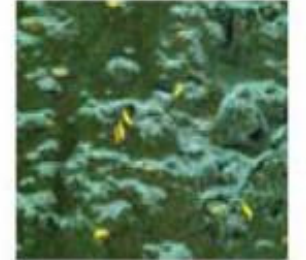
আংশিক ভাবে পানী জমা হলে অংকুৰিত নহব পাৰে