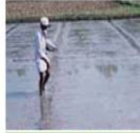
বোকা মাটিত ধান সিঁচা

সাধাৰণতে দেখা যায় কৃষকে বীজৰ মানদণ্ড এন্দুৰ, চৰাই শামুক আদিৰ পৰা হব পৰা অতিৰ কথা ভাবি প্ৰয়োজনকৈ অধিক হাবত বীজ পথাৰত সিঁচি।